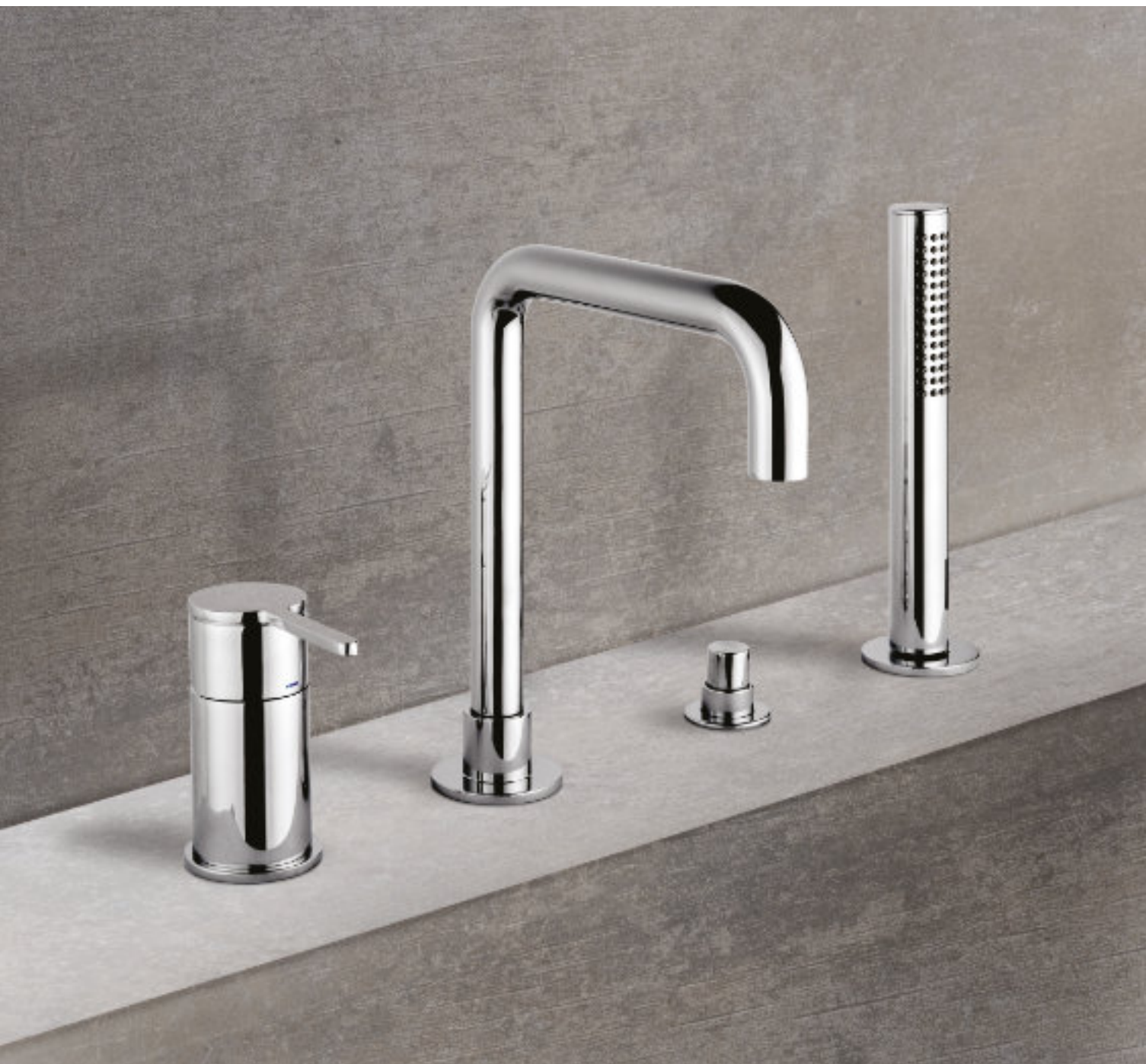
^ Art. CR85120 Miscelatore bordo vasca. Single-lever deck mounted bath mixer. Mitigeur baignoire sur gorge. 4-Loch Wannendarmatur.