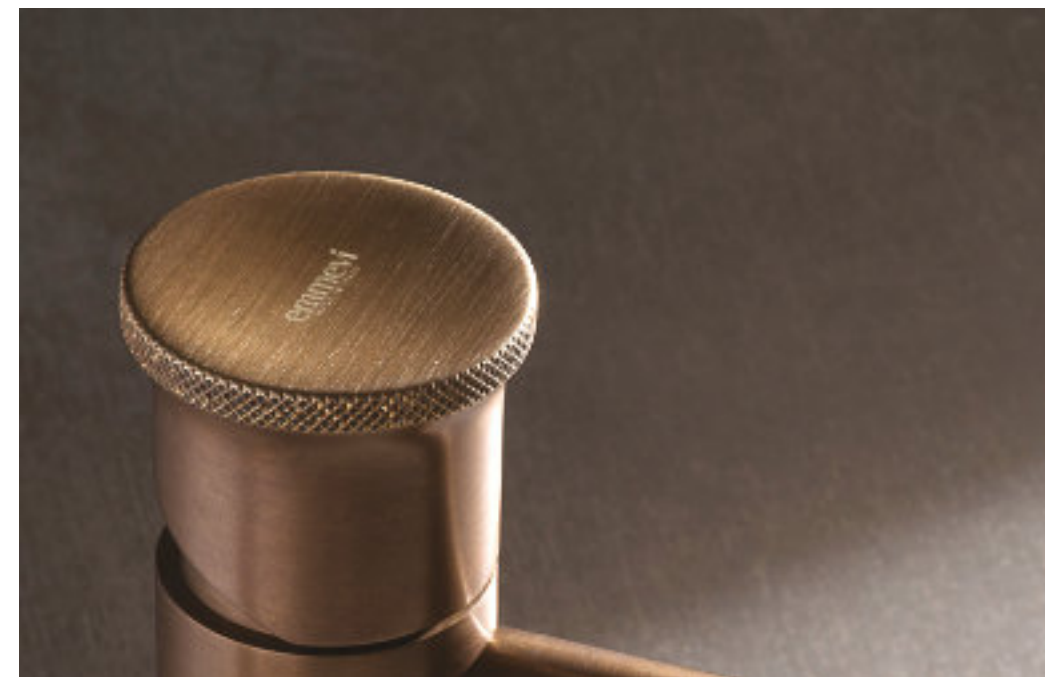
^ Art. GF85003 Dettaglio: maniglia con stelo, finitura "Grafite". Detail: handle with stem, "Graphite" finish. Détail: poignée avec tige, finition "Graphite". Detail: Griff mit Schaft, "Grafit"- Finish.