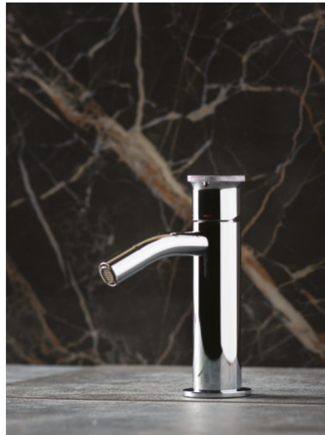
< Art. TS85003 Miscelatore lavabo con scarico. Single-lever basin mixer with waste. Mitigeur lavabo avec vidage. Einhebel-Waschtischmischer mit Ablaufgarnitur.