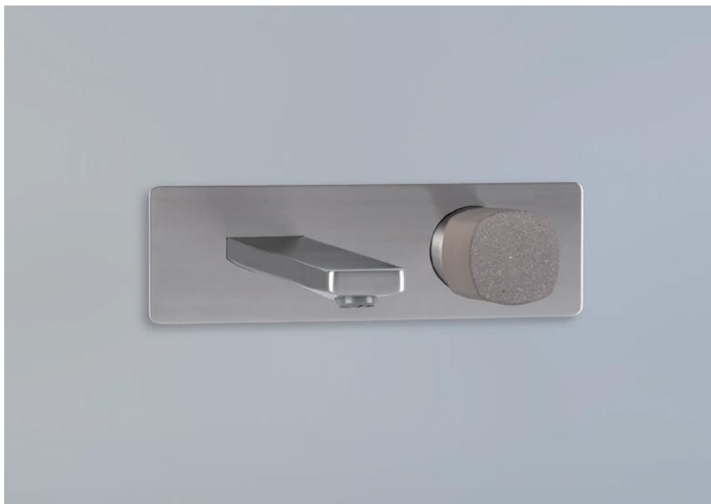
PR43AY102IX | PR43MC001CEM