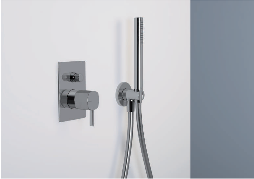
PR43GM101CRL | PR43MC101CRL | 72J001CRL