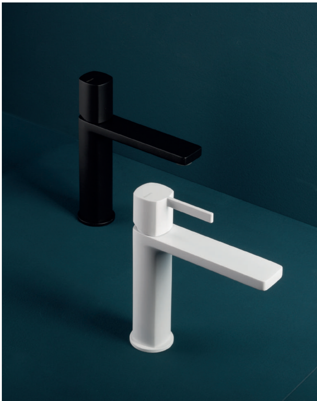
PR43AU201C04 | PR43MA001C04 | PR43AU201C03 | PR43MA101C03