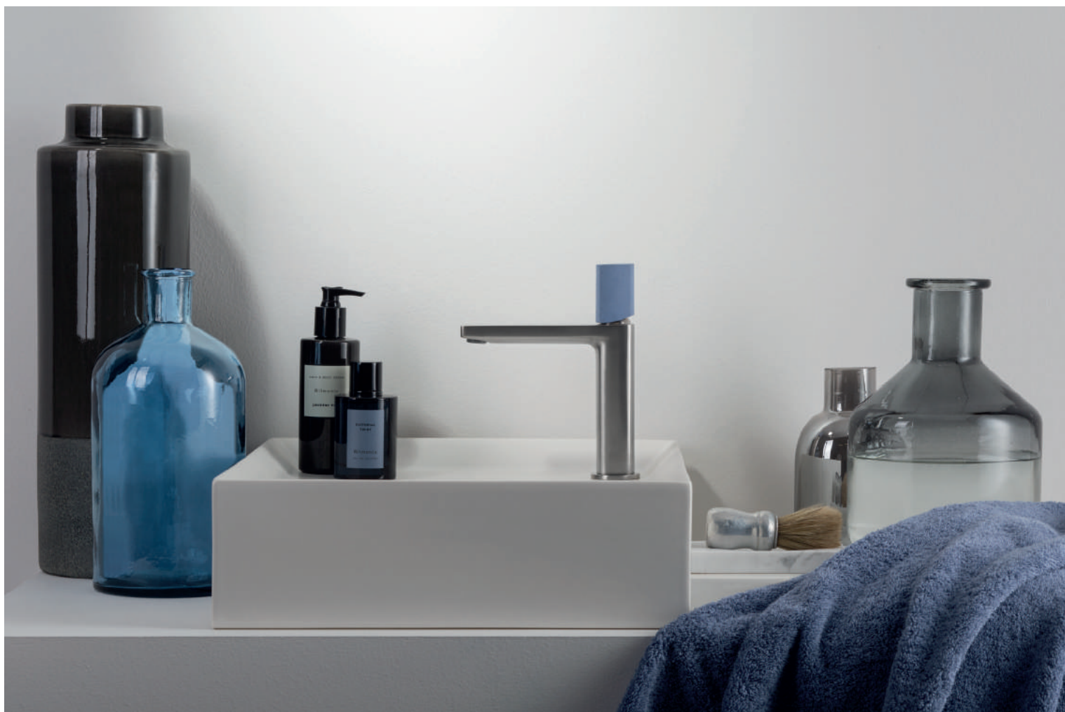
PR43AU101IX | PR43MA001M08