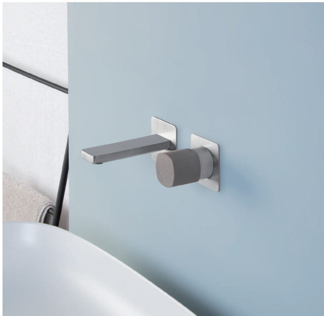
PR43AY201IX | PR43MC001CEM