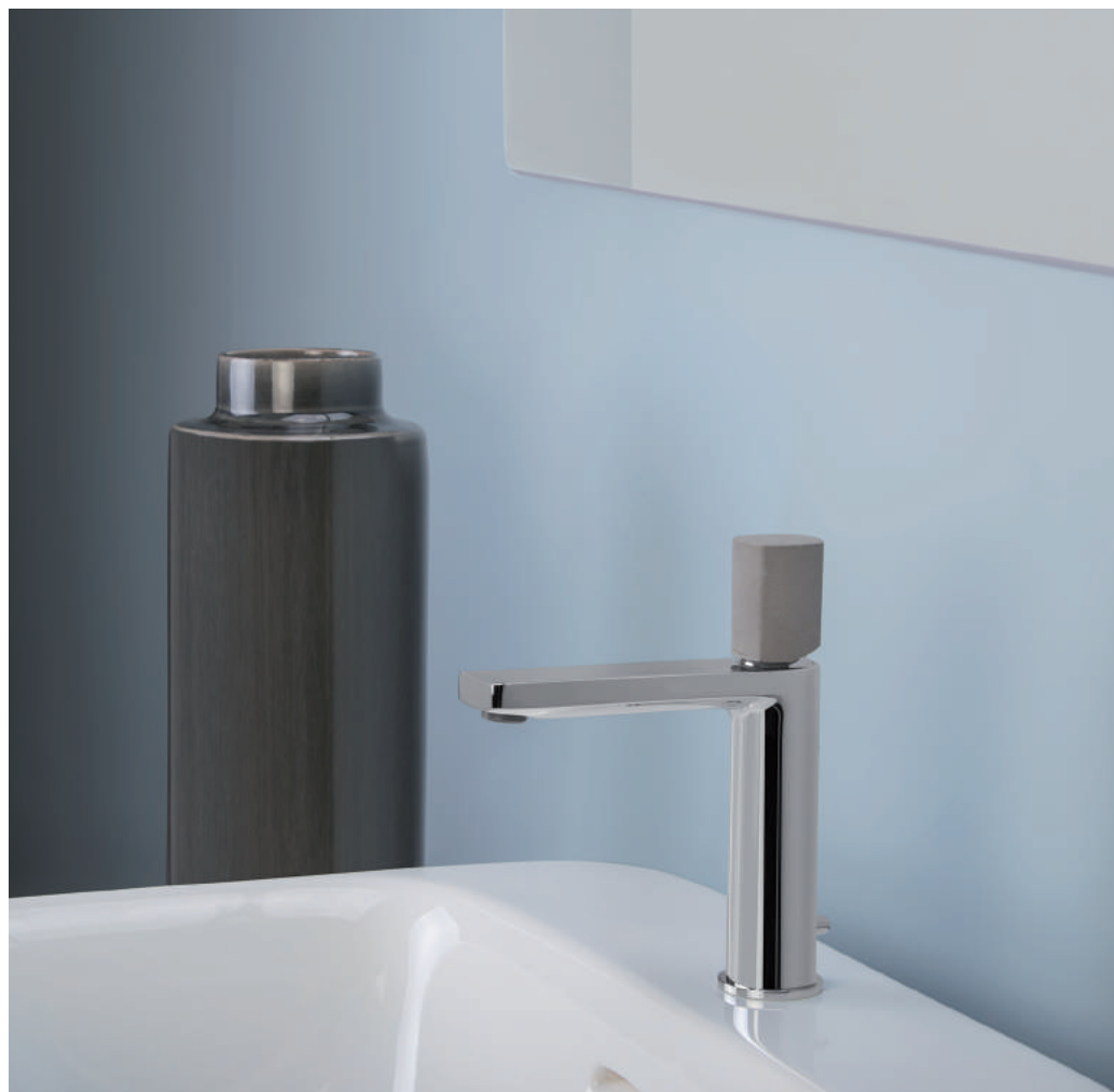
PR43AU101CRL | PR43MA001CEM