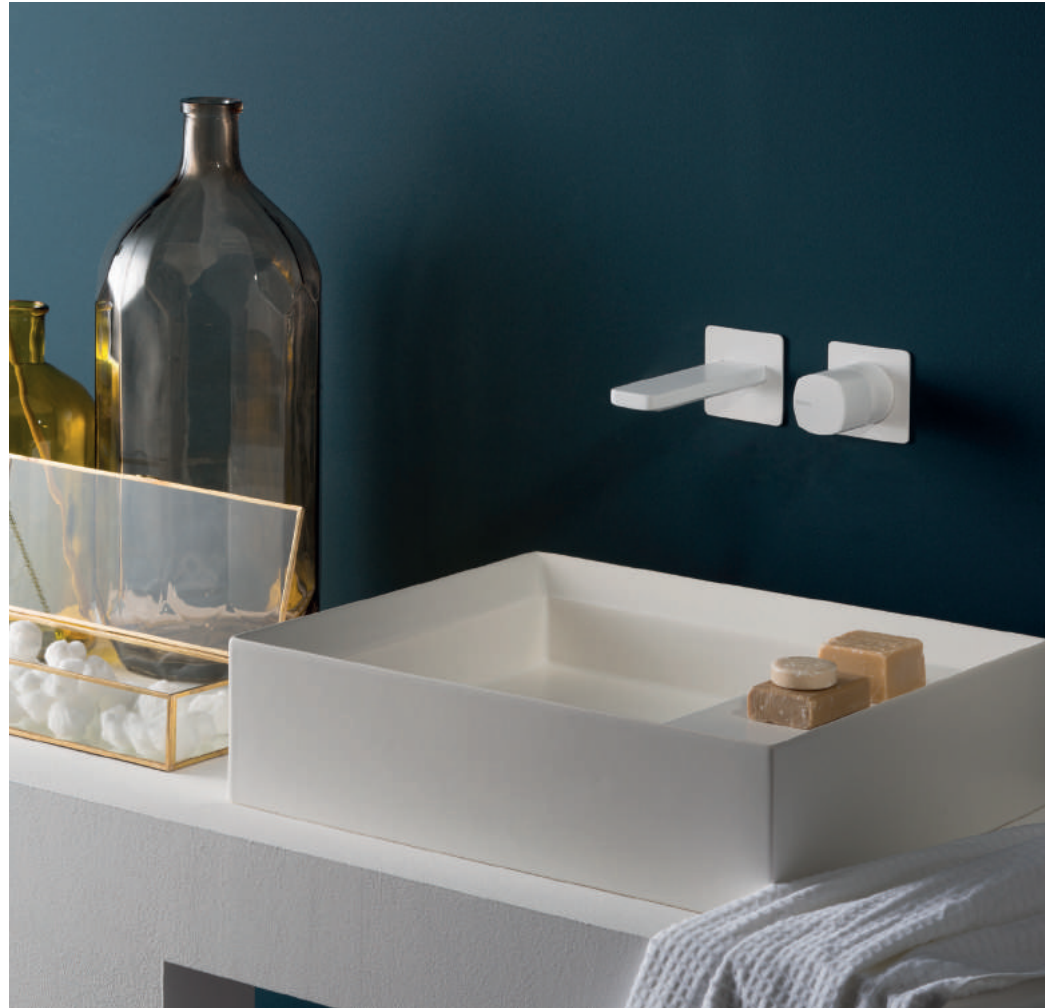
PR43AY201C03 | PR43MC001C03