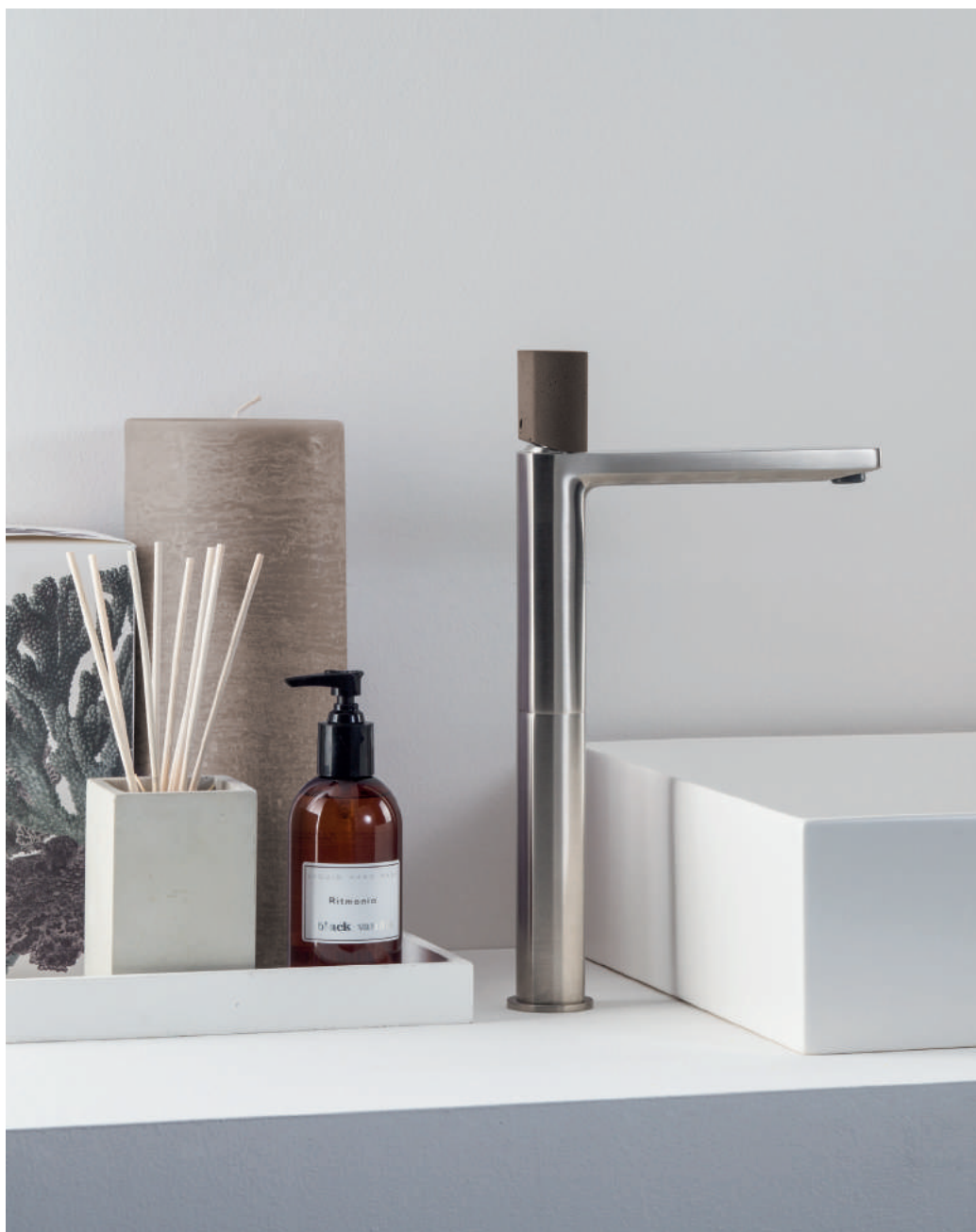
PR43AV201IX | PR43MA001M05