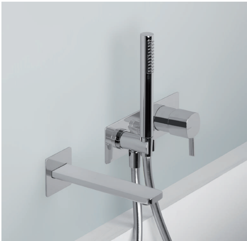
PR43EM101CRL | PR43MC101CRL