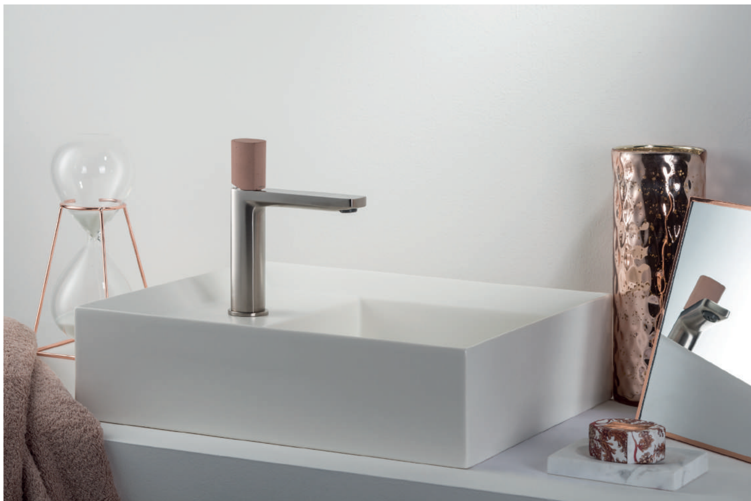
PR43AU101IX | PR43MA001M07