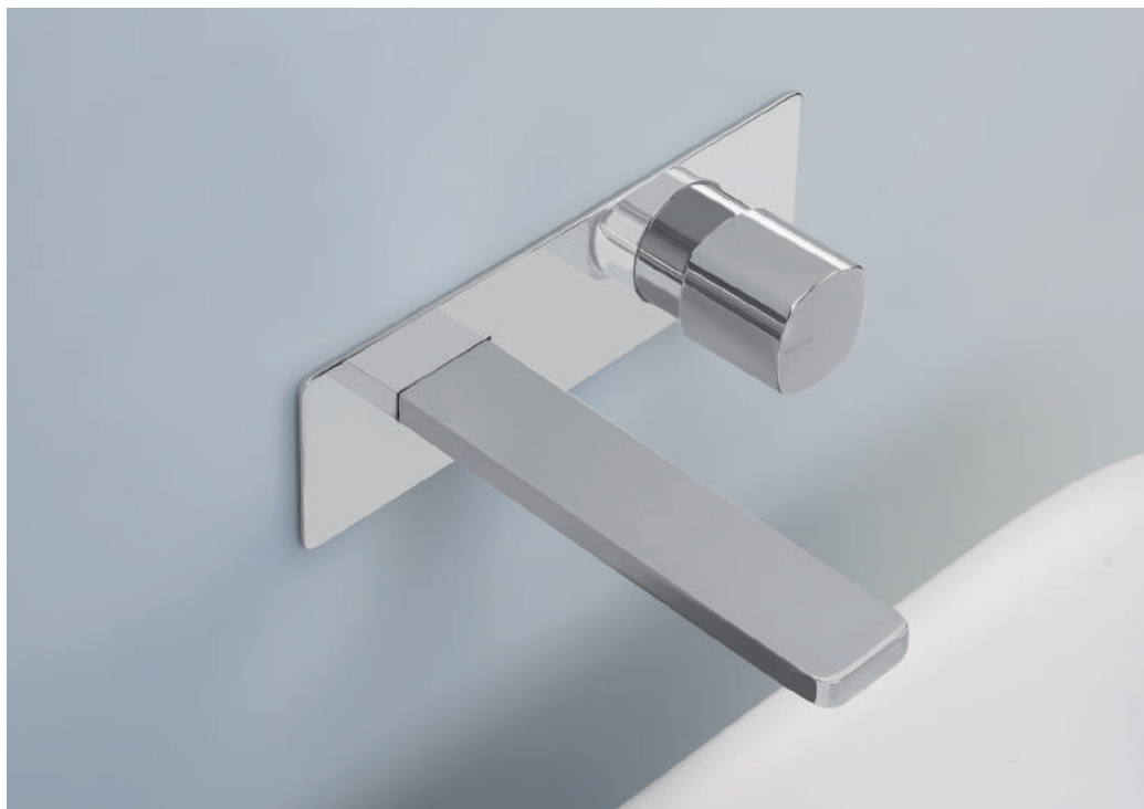
PR43AY102CRL | PR43MC001CRL