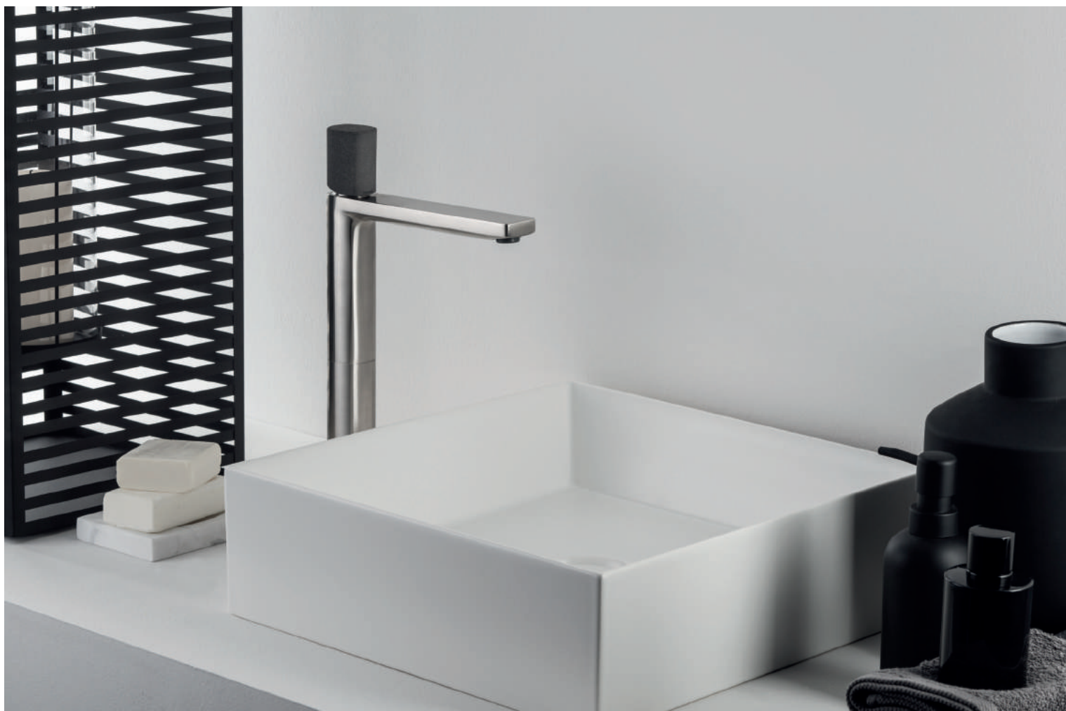
PR43AV201IX | PR43MA001M04