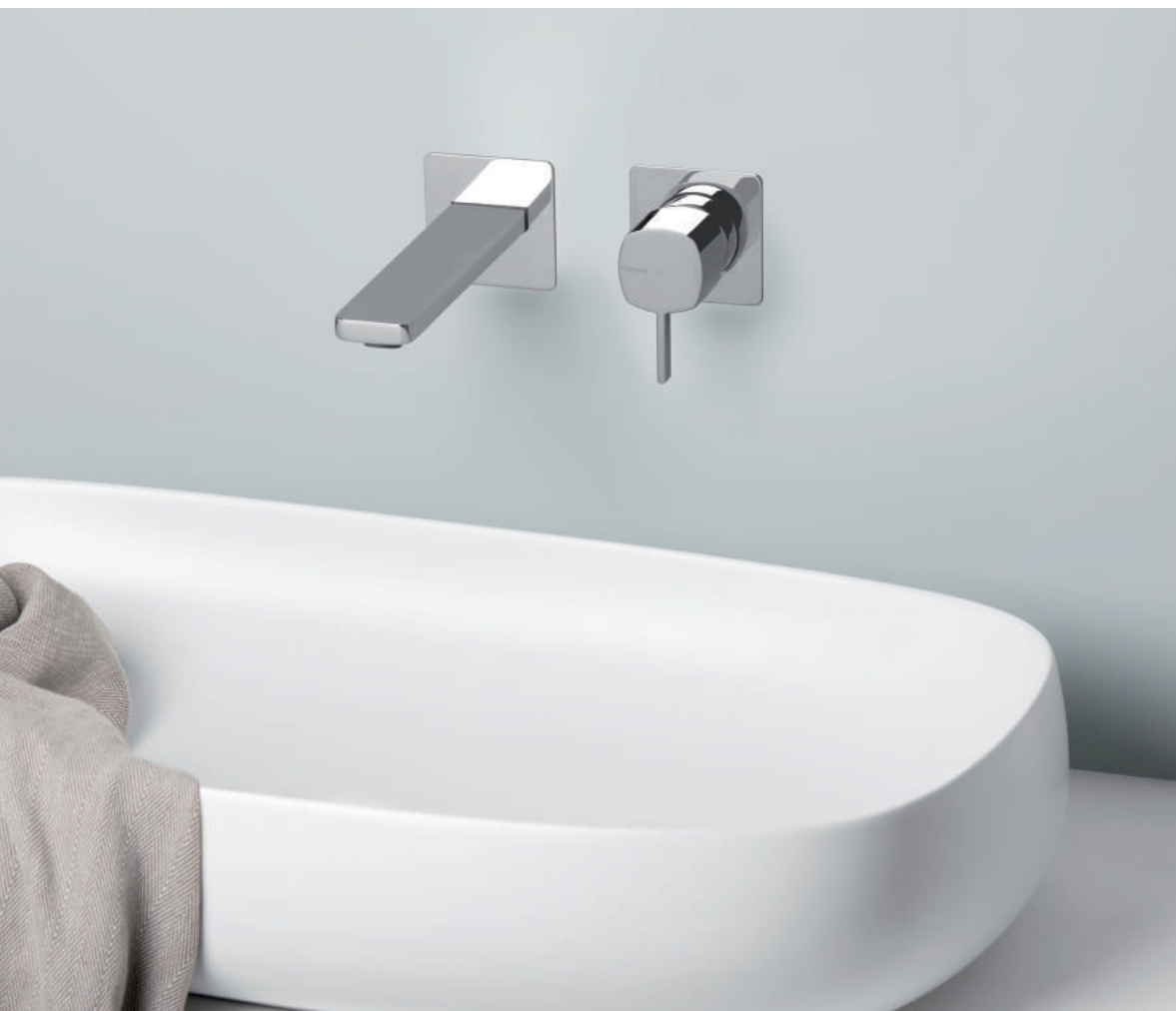
PR43AY201CRL | PR43MC101CRL