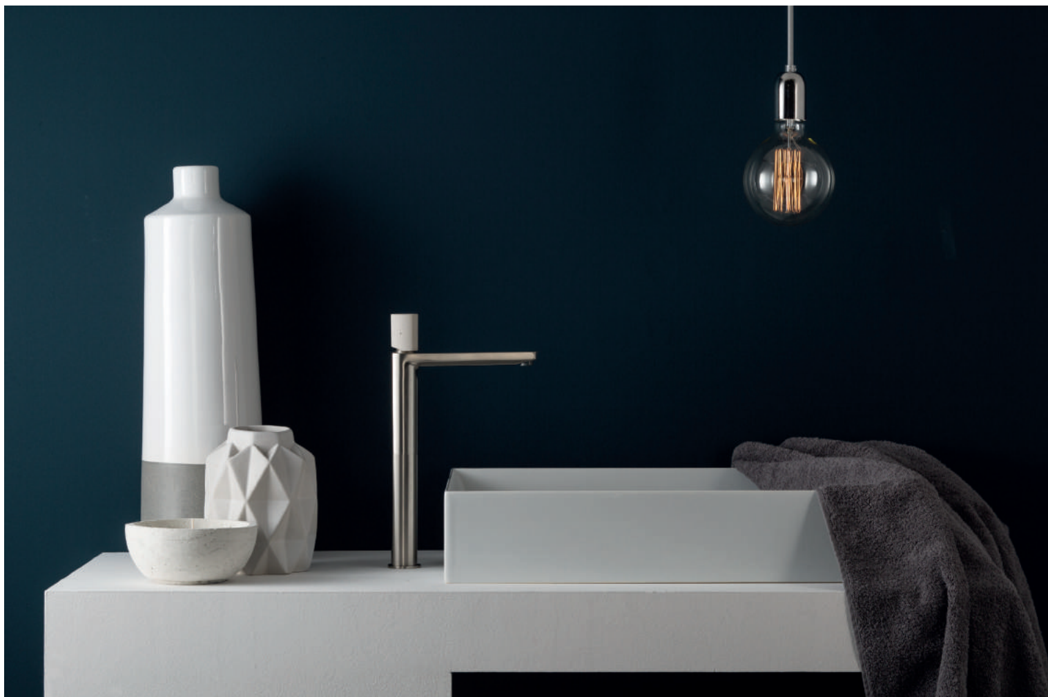
PR43AV201IX | PR43MA001M03