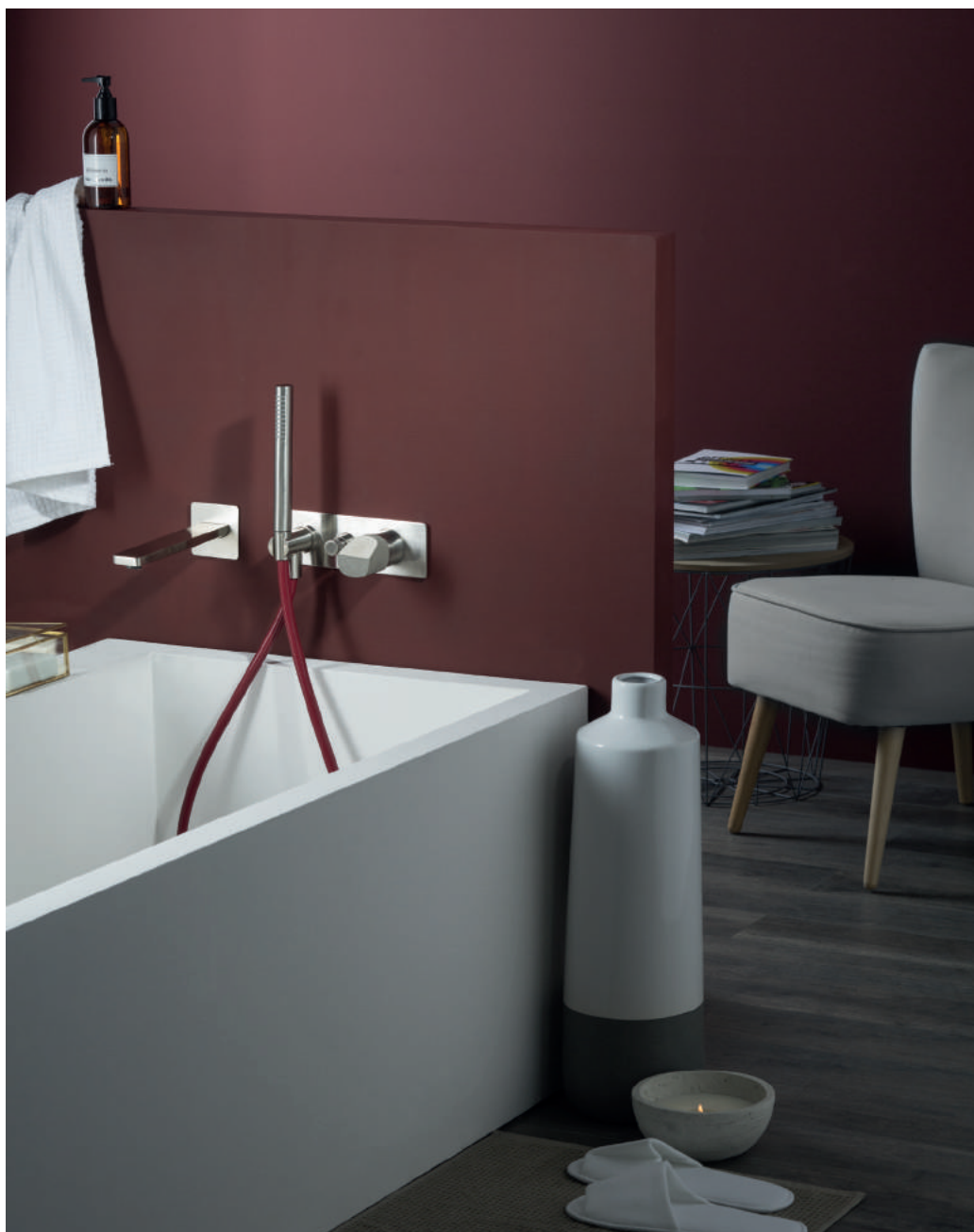
PR43EM1S1IX | PR43MC002CEM | 72F004C51