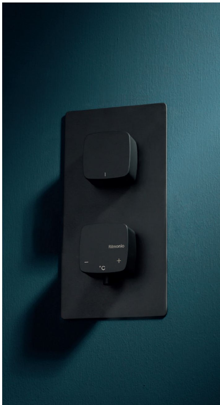
PR43HB201C04 | RCMBA004C04