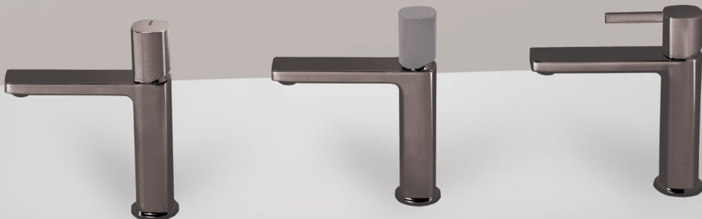
PR43AU101CRB | PR43MA001CRB | PR43AU101CRB | PR43MA001CEM | PR43AU101CRB | PR43MA101CRB