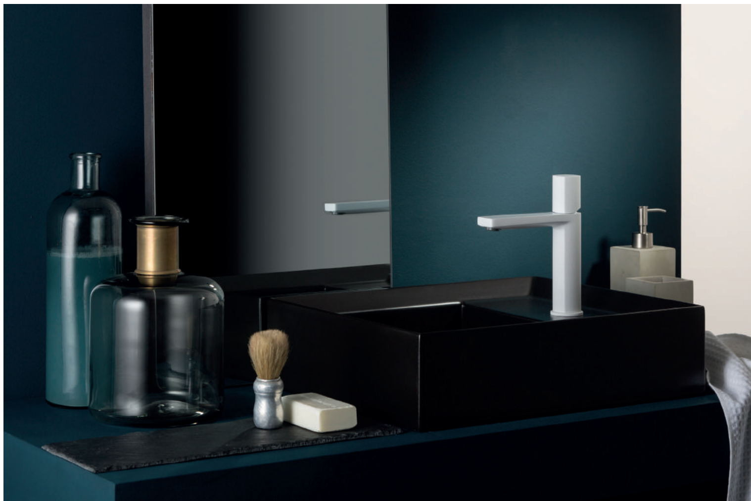
PR43BU101C03 | PR43MA001C03