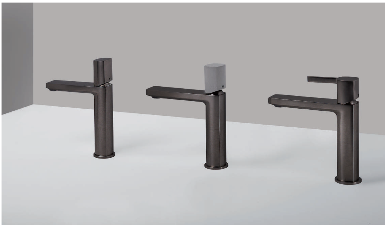
PR43AU101BLX | PR43MA001BLX | PR43AU101BLX | PR43MA001CEM | PR43AU101BLX | PR43MA101BLX