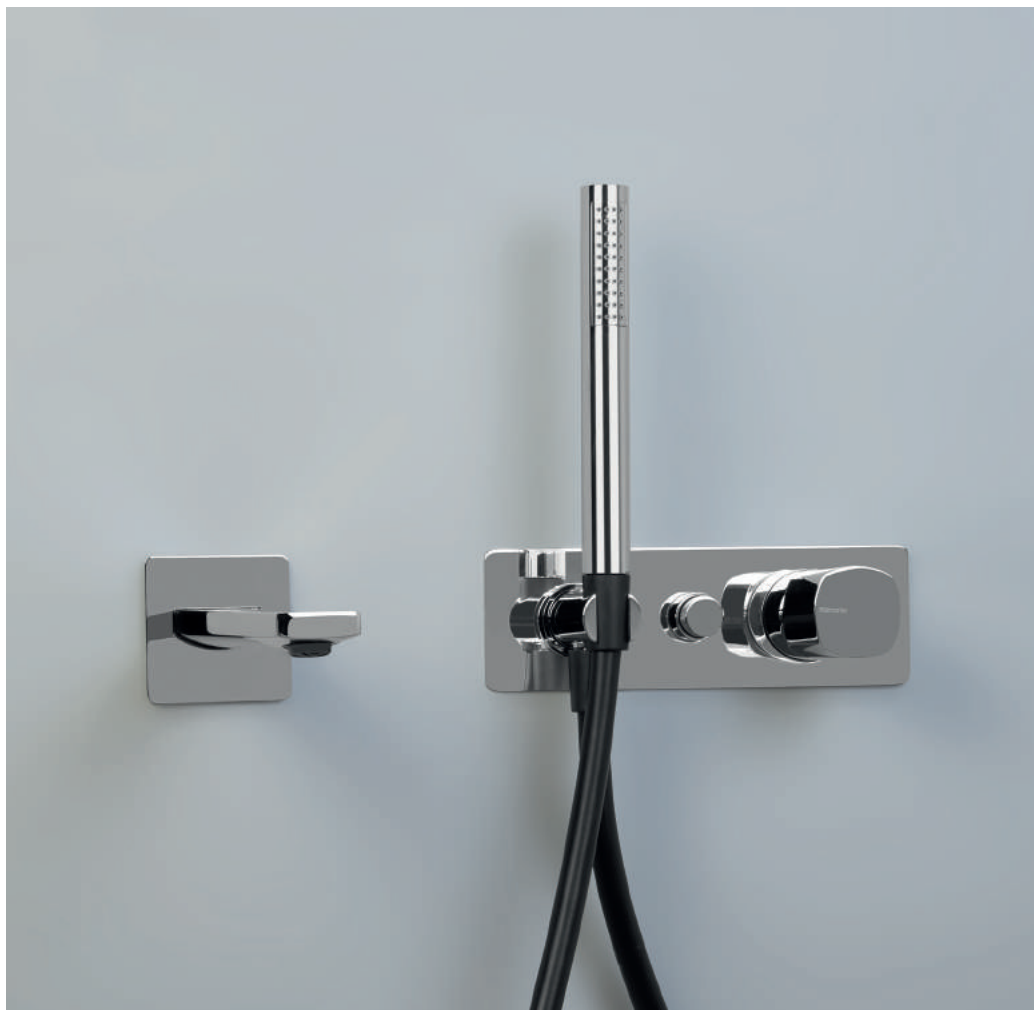
PR43EM1S1CRL | PR43MC001CRL | 72F005C04