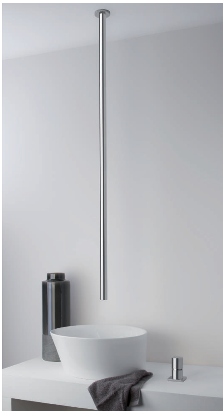
PR43AS201CRL | PR43MM001CRL | E0BA0185H03CRL