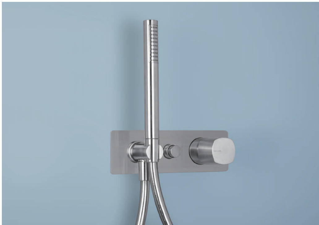
PR43GQ101IX | PR43MC001IX