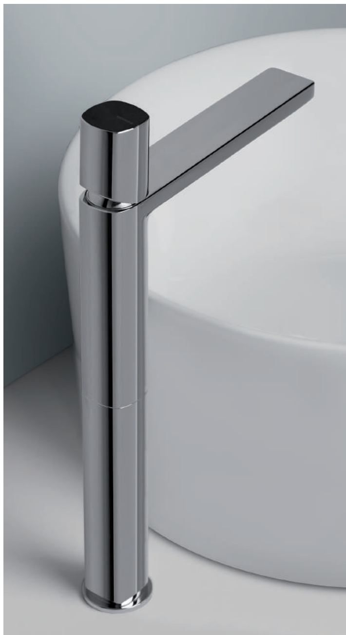
PR43AV201CRL | PR43MA001CRL