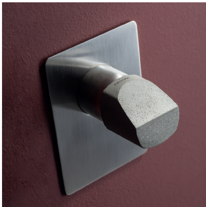
PR43FM101IX | PR43MC002CEM