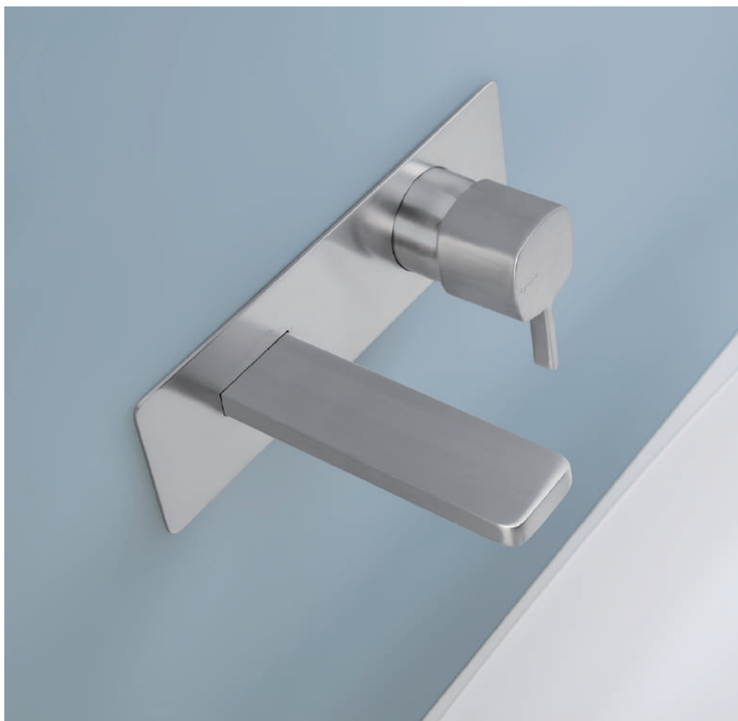
PR43AY101IX | PR43MC101IX