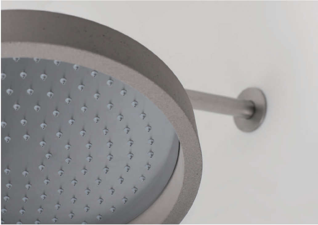
75S011INOX | Q0BA6068IX | 75C001CEM