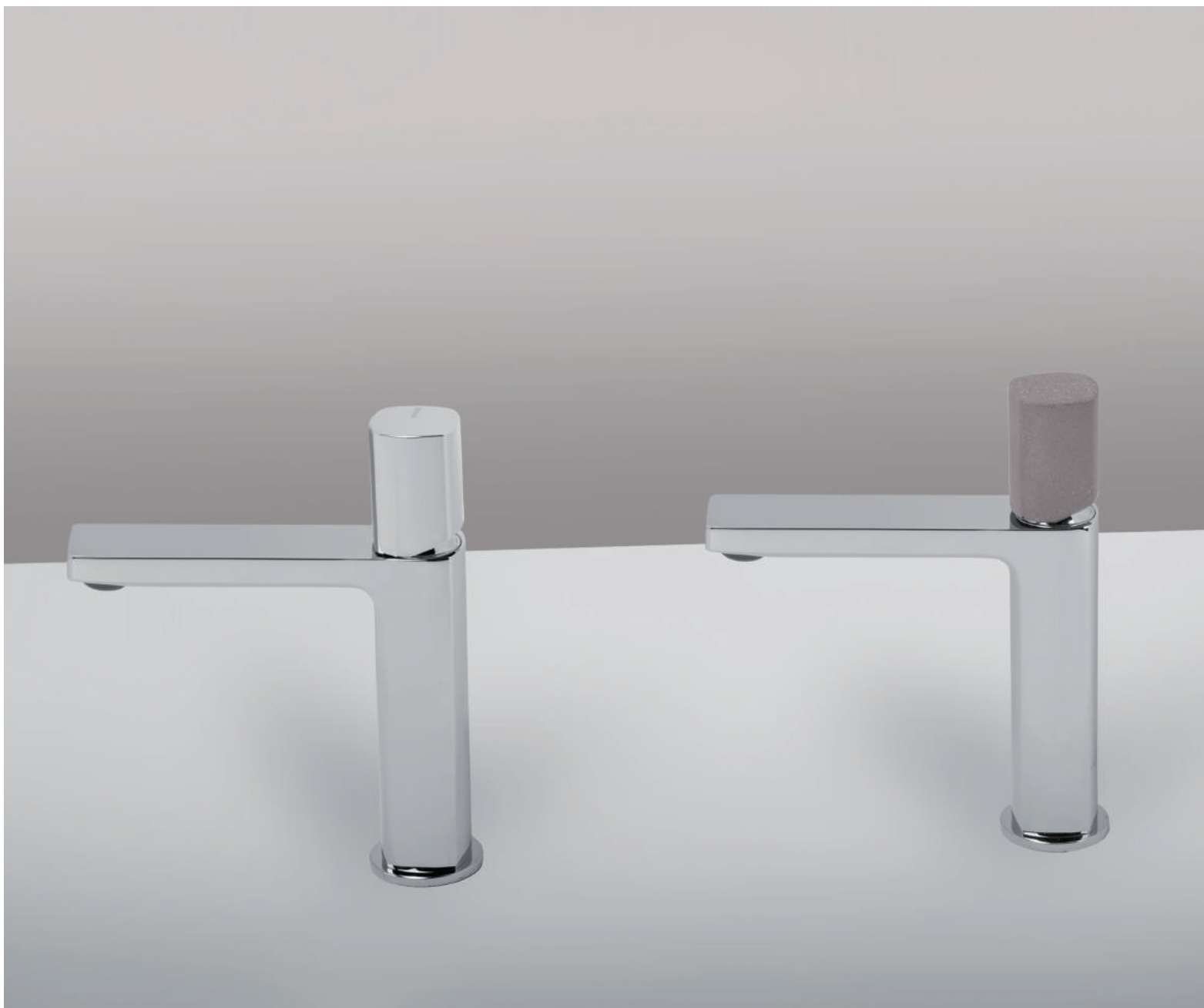
PR43AU201CRL | PR43MA001CRL | PR43AU201CRL | PR43MA001CEM | PR43AU201CRL | PR43MA101CRL