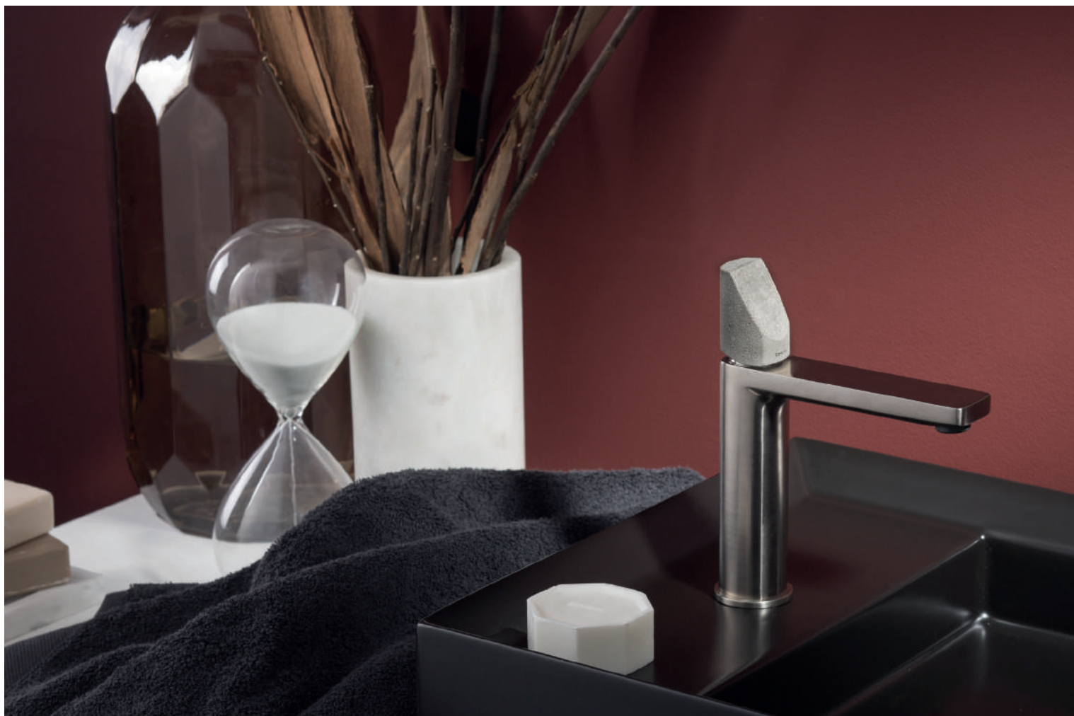
PR43AU201IX | PR43MA002CEM