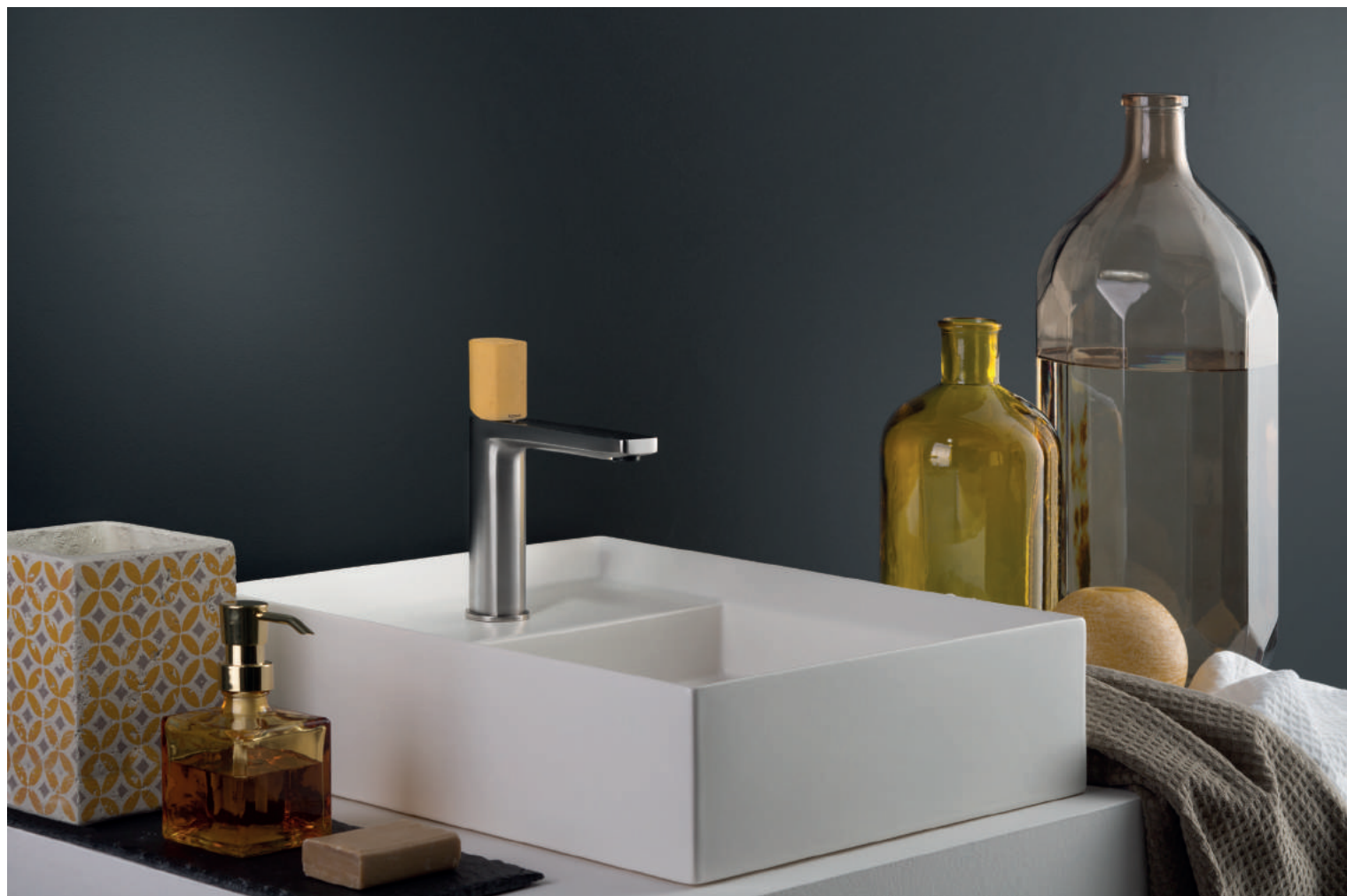
PR43AU101IX | PR43MA001M02