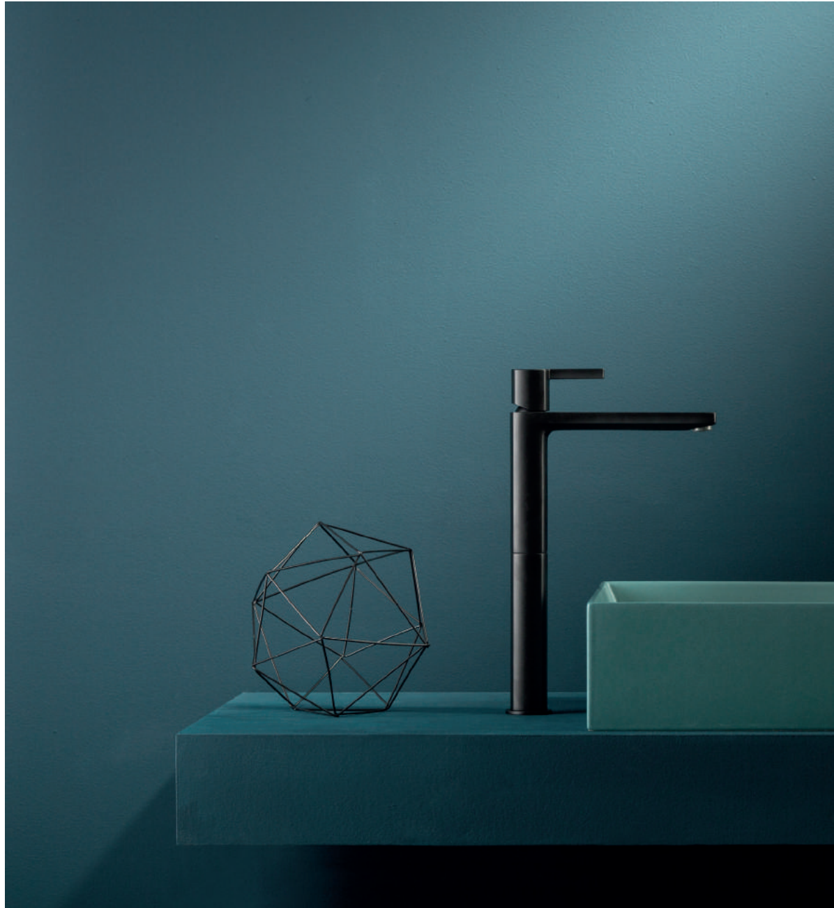
PR43AV201C04 | PR43MA101C04