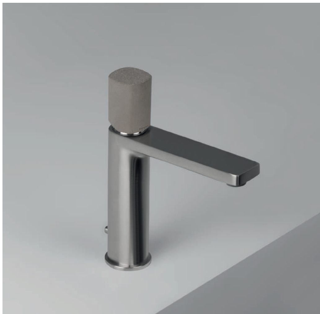
PR43AU101IX | PR43MA001CEM