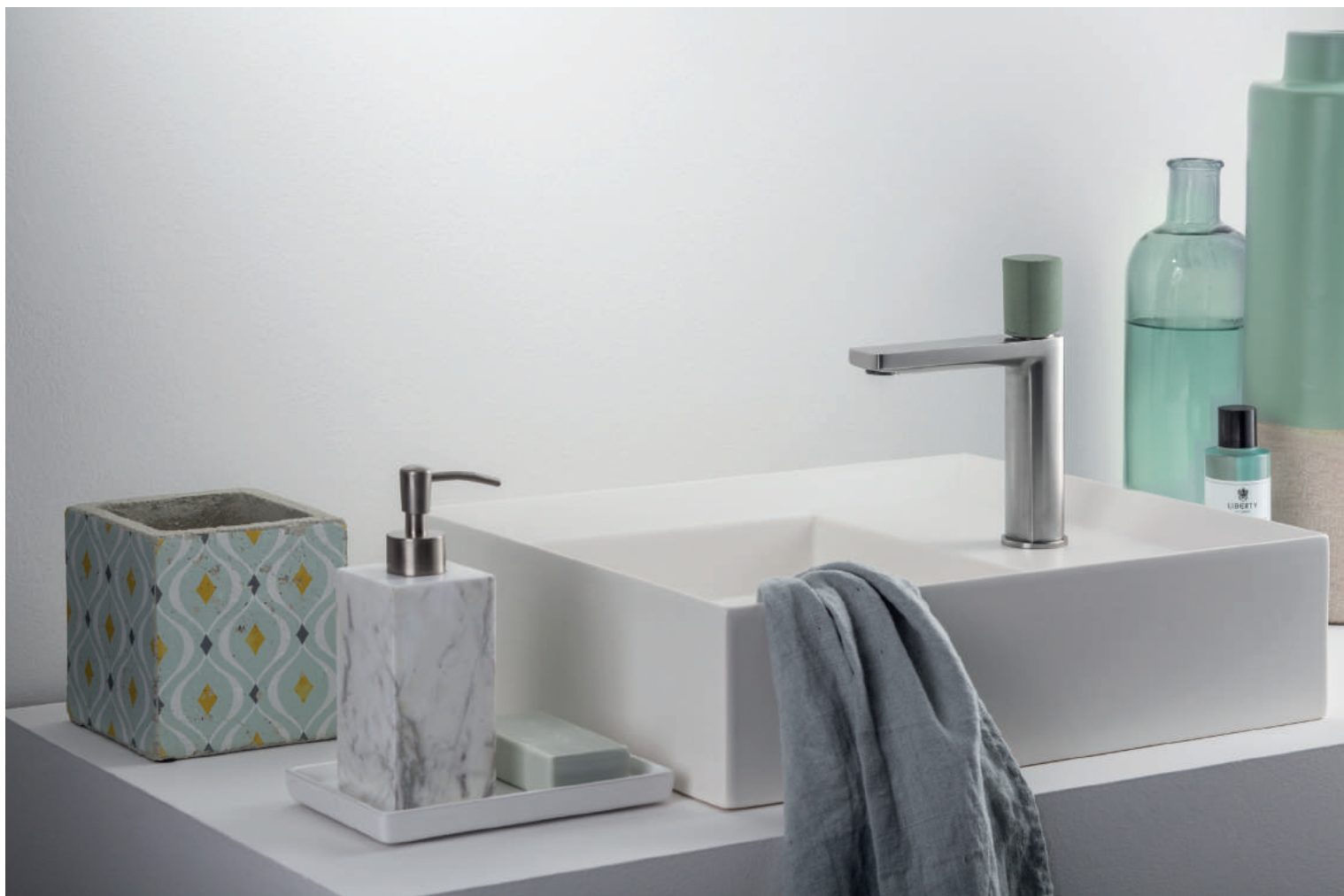
PR43AU101IX | PR43MA001M01