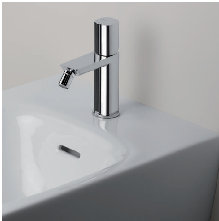
PR43BU101CRL | PR43MA001CRL