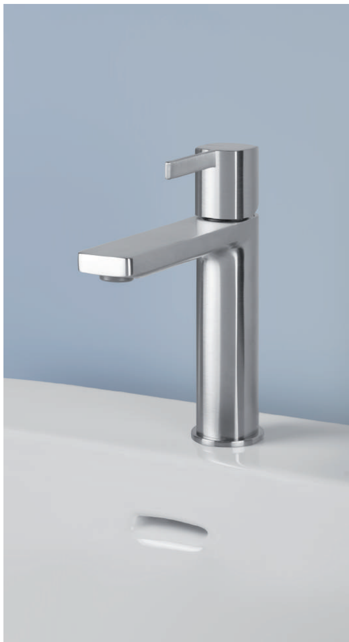
PR43AU201IX | PR43MA101IX