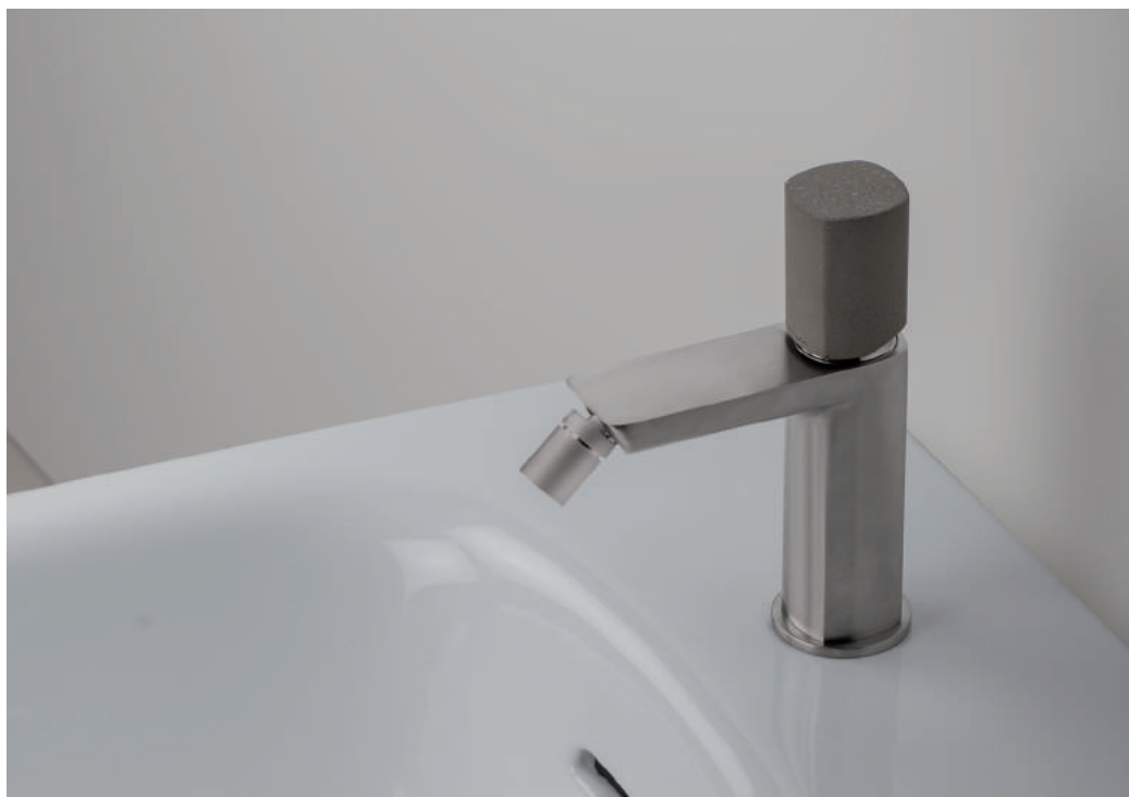
PR43BU201IX | PR43MA001CEM