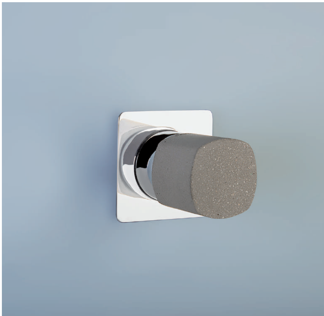
PR43FM201CRL | PR43MC001CEM