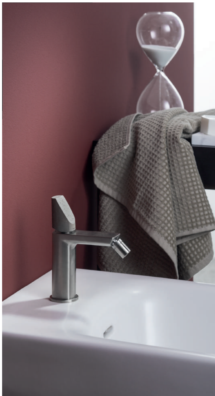
PR43BU201IX | PR43MA002CEM