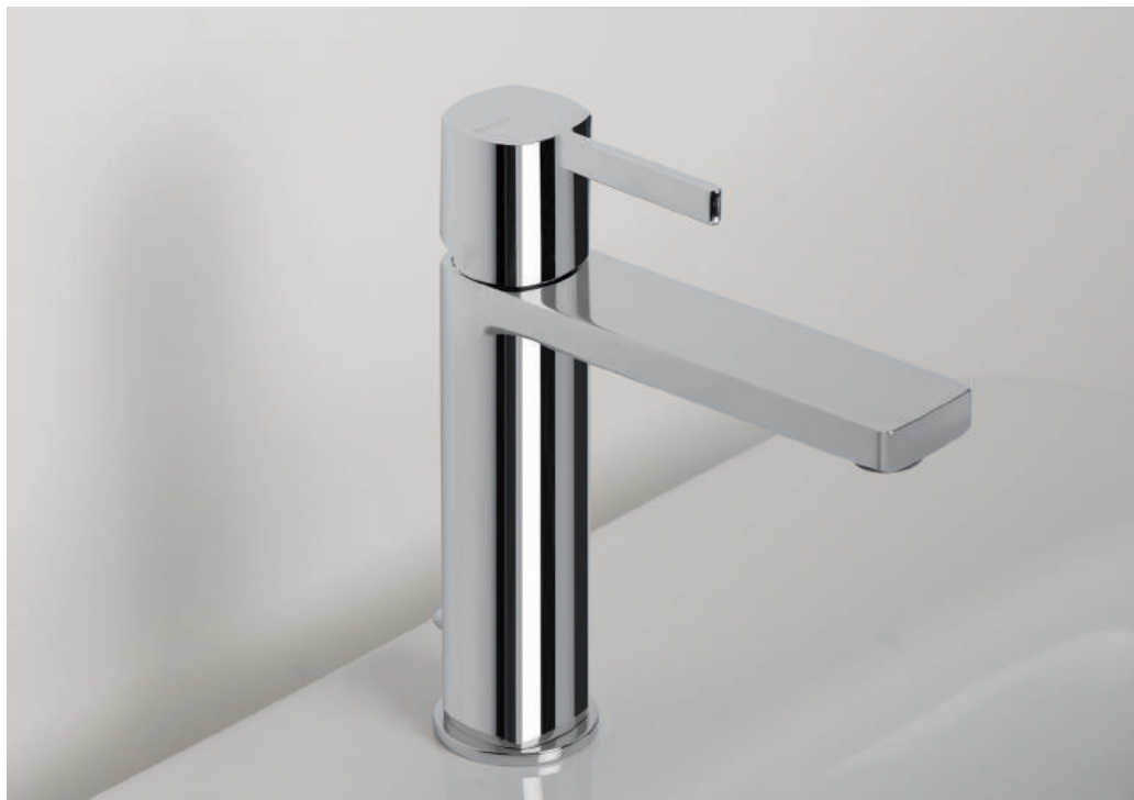
PR43AU101CRL | PR43MA101CRL