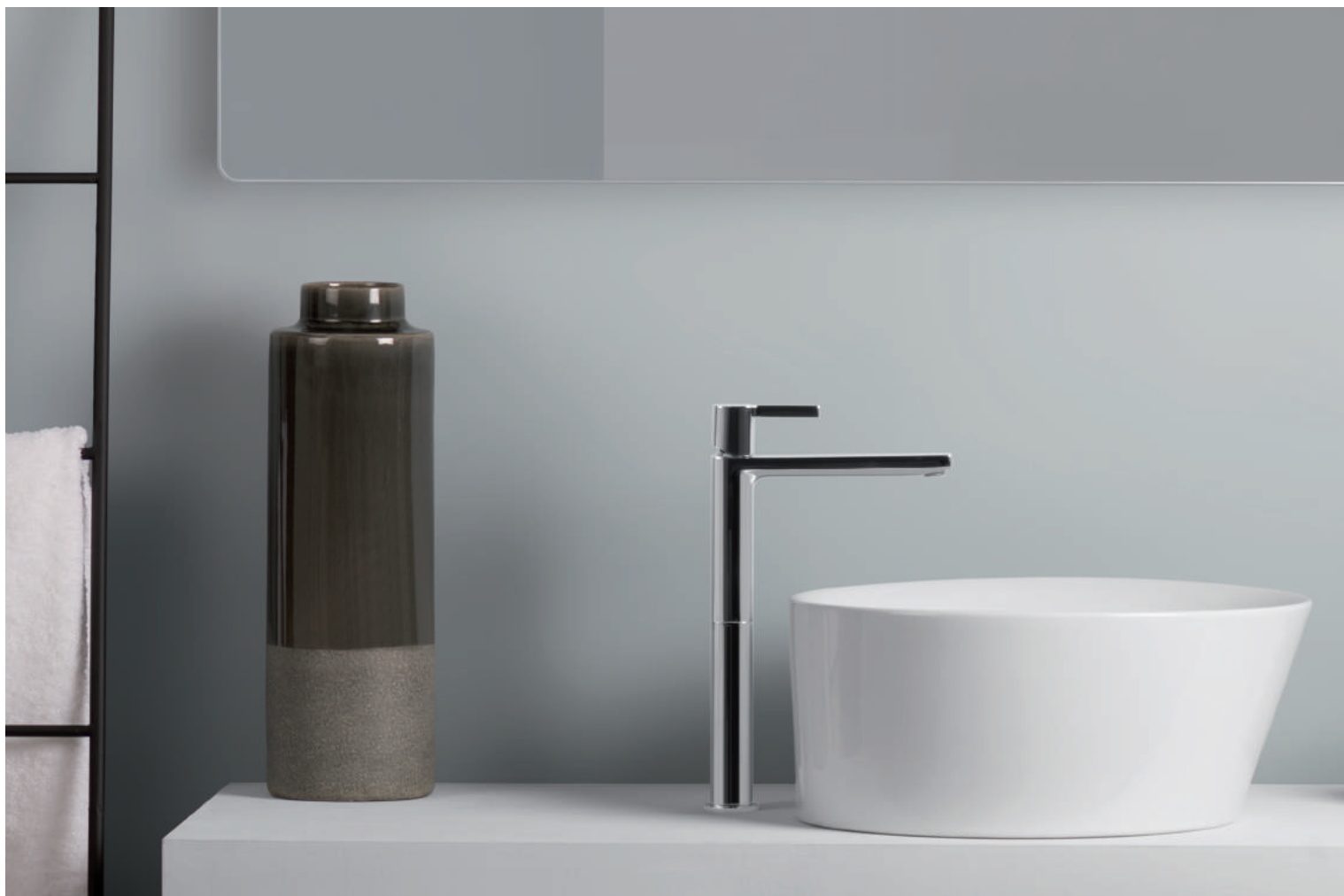
PR43AV201CRL | PR43MA101CRL